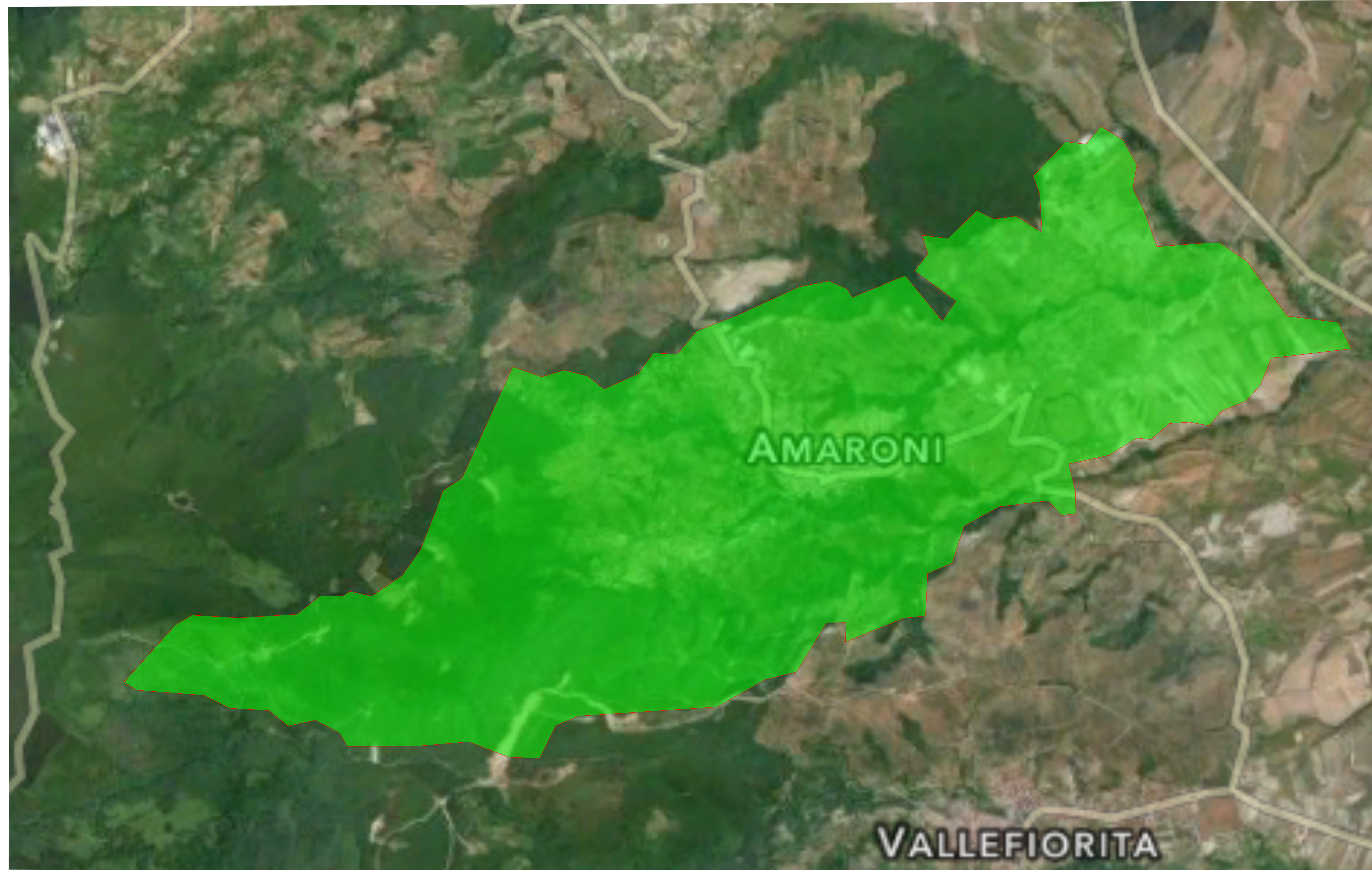
AEROFOTO intercomunale rapp. 1: 10000